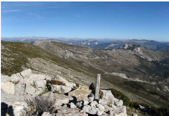
Depuis le Pioulet

Si nous avons de la chance, nous pourrions même admirer les vautours fauves du Verdon. C'est sur cette commune que s'effectue le programme de recolonisation par le Vautour Fauve des Alpes du Sud et notamment de la Haute-Provence, avec, entre 1999 et 2005, le lâcher de 91 vautours fauves.