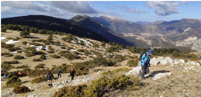
A l'assaut du Pensier!

Nous remontons le cours de l' Estéron sur quelques kilomètres par une piste. Simple cours d'eau à cet endroit, nous le traversons à deux reprises par une passerelle et un gué.