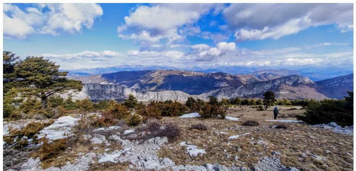
Depuis le Pensier Oriental