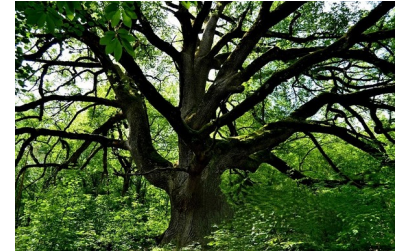
Chêne de Pascaline

Le sentier de liaison entre Conségudes et les Ferres passe par un point remarquable : le chêne de Pascaline . Ce chêne pubescent, est l'un des plus vieux et des plus grands spécimens d'Europe. On estime qu'il a entre 400 et 500 ans. C'est un arbre majestueux dont les branches étalées offrent un ombrage important. Son nom proviendrait de la propriétaire du terrain sur lequel il se trouve, bien que cela ne soit pas certain. Il témoigne de l'histoire et du patrimoine naturel de la région.