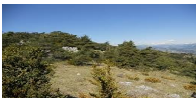
Les 4 Chemins

Les Ferres et Conségudes se font face, chacun construit au pied d'un mont : le mont Saint-Michel pour Les Ferres et le mont Saint-Paul pour Conségudes.