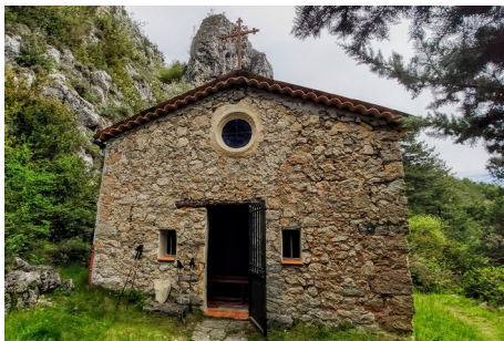
Chapelle Saint Martin

Le Teillon, massif calcaire des Préalpes, est un poste d'observation privilégié sur tout l'est provençal : Var, Alpes Maritimes, Verdon, Haut-Verdon, Haute Vallée du Var, Mercantour.