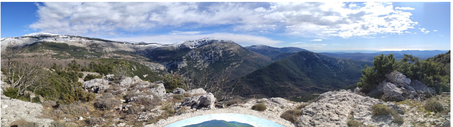
Table d'orientation du plateau de Briascq