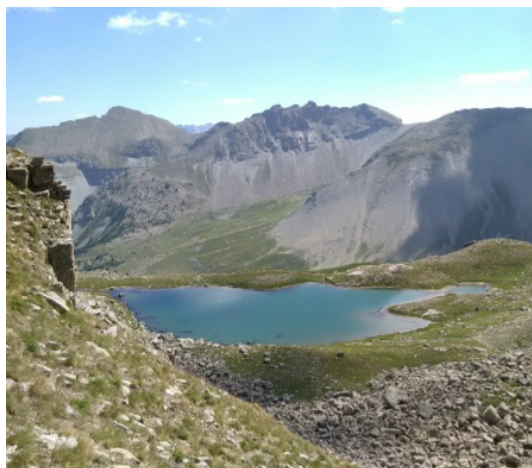
Lac supérieur de Gialorgues