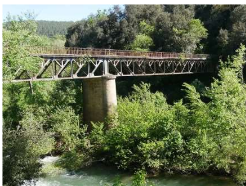
Le Pont d'Aille (pont Eiffel)