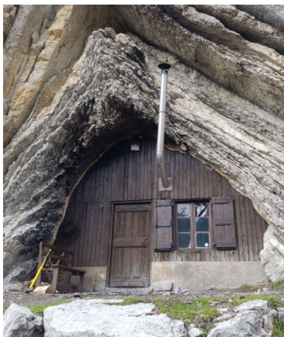
Cabane troglodyte de Boules