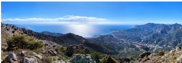
Depuis le col du Berceau

La montée vers le Col du Berceau (1090m) à travers les terrasses d'oliviers puis une forêt de pins sera le pivot de la randonnée. Un des panoramas les plus spectaculaires des Alpes-Maritimes : une vue plongeante à 1 100 m d'altitude sur la mer. La vue s'ouvre brutalement sur Menton, l'Italie et, par temps clair, la Corse. C'est l'endroit idéal pour notre pause repas.